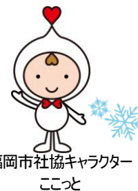
福岡市社協キャラクター ここと

地域のみなさんや関係機関の方々に向けて社協ワーカー（職員）の動きや社協の事業について情報発信するお便りです！！