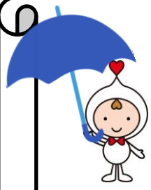
福岡市社協キャラクター ここと